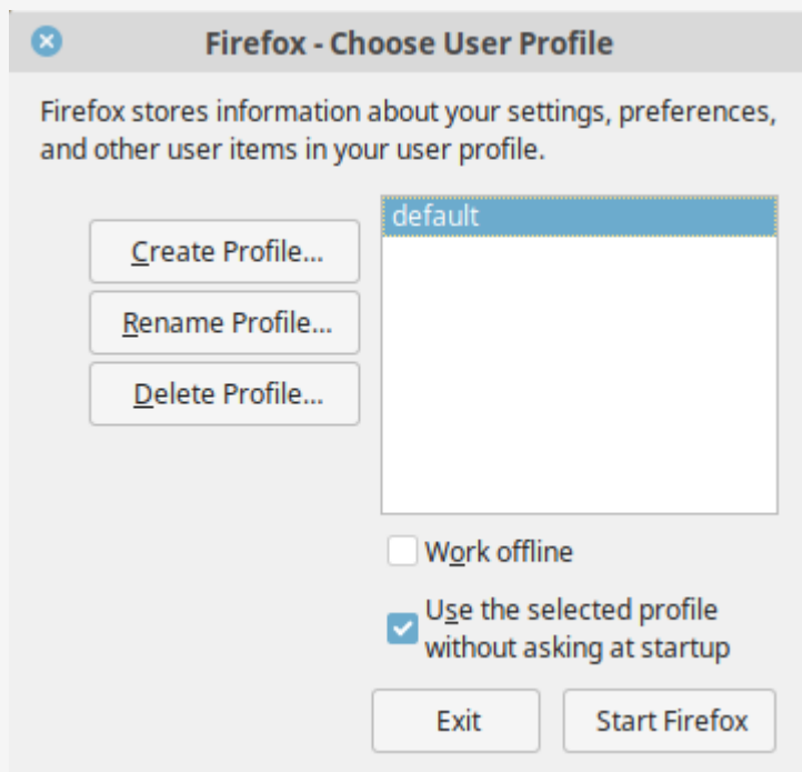
Firefox Gestionnaire de profils